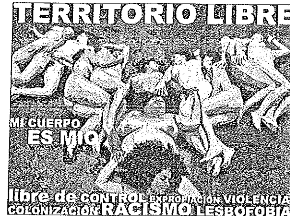
Cartel en ocasión del encuentro mesoamericano del III Foro de las Américas, octubre 2008

incluyendo a algunas indígenas guatemaltecas 128 , colgando en la Tienda de las mujeres un cartel donde 11 mujeres posan desnudas y abrazadas, con la leyenda: "Territorio libre. Mi cuerpo es mío. Libre de control, expropiación, violencia, colonización, racismo, lesbofobia". Pues esta visibilidad repentina del cuerpo (desnudo) de las mujeres, en una perspectiva de auto-representación, reapropiación y libertad, está también conectada a un creciente desarrollo de los análisislésbicos y feministas 129 .